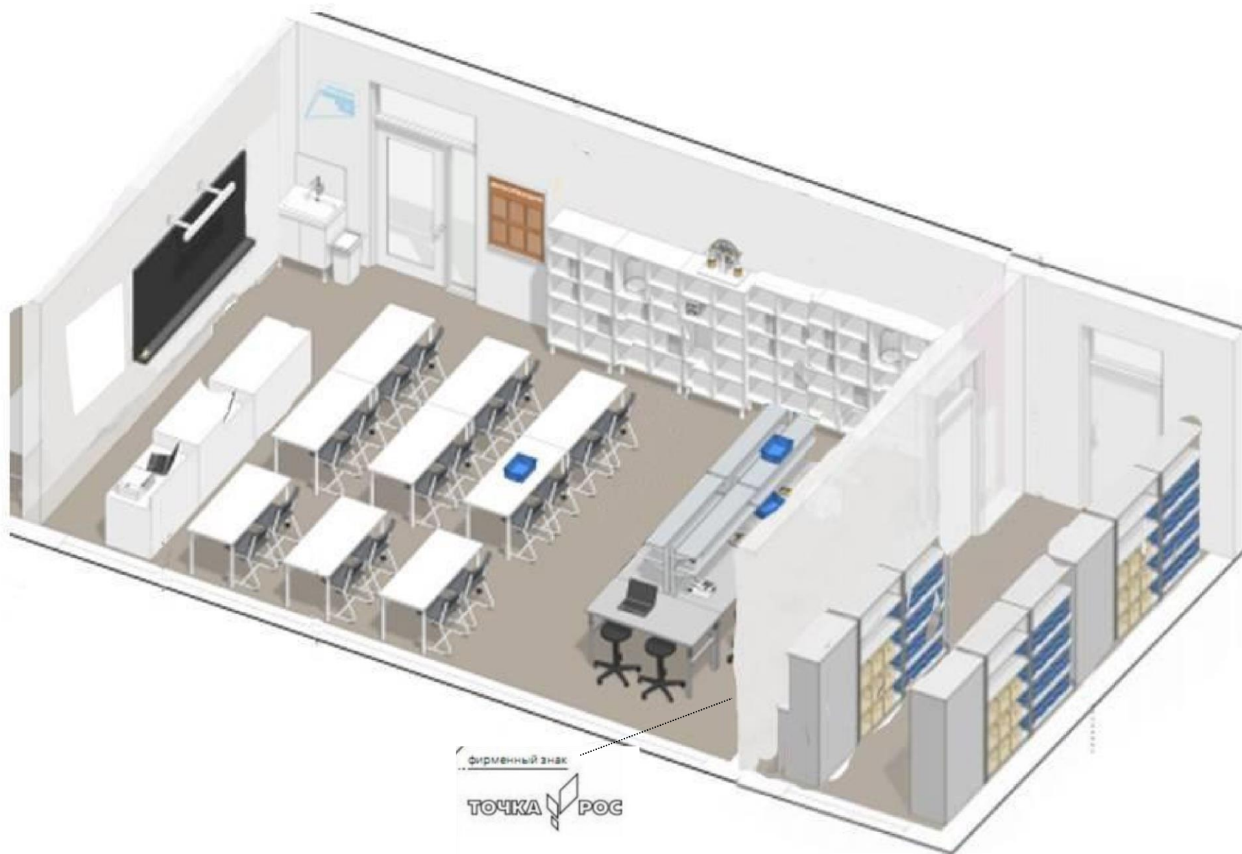
«Точка роста» третий этаж, кабинет химии и биологии.